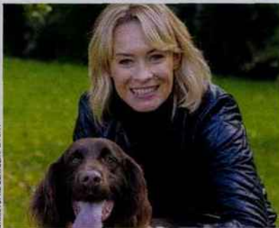
CHRISTOPHE BERTOLINI / LA SPA